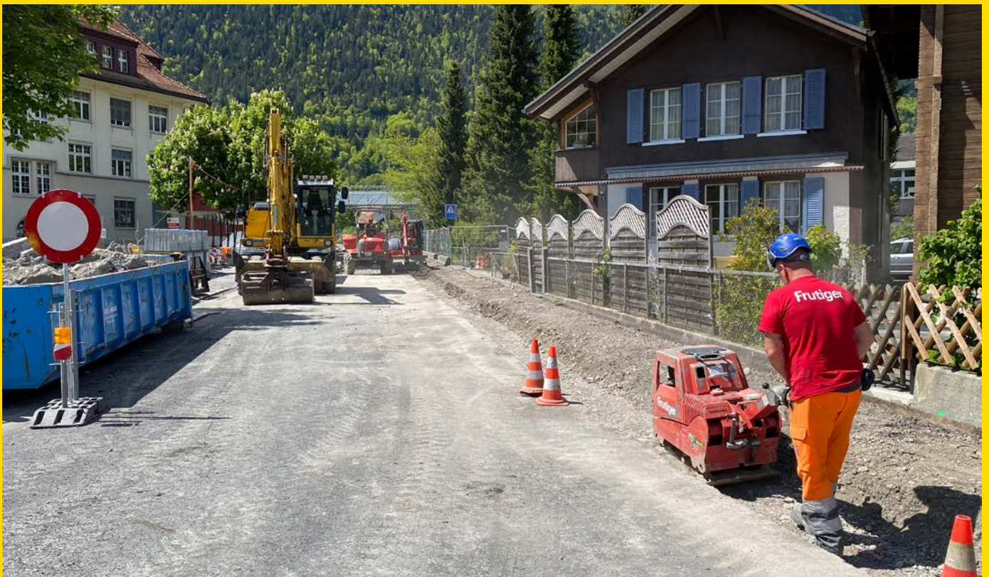
Vorgezogene Strassenbauarbeiten in der Steindlerstrasse

Die Netzfüllung und Inbetriebnahme der neu erstellten Fernwärmeleitungen ist Mitte August 2021 geplant.