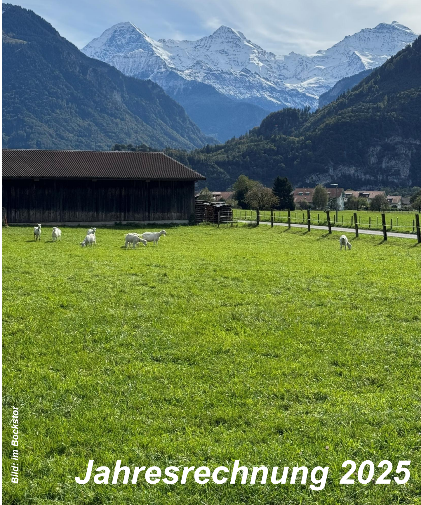
Bild: im Bockstor