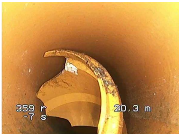
Hindernis in der Leitung